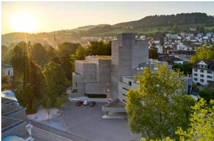
Das Theater St.Gallen hat Strahlkraft über die Bodenseeregion hinaus.

Die Stärke des Theaters lag immer schon darin, dass es mehr ist als ein Schauspiel, eine Oper oder ein Konzert auf einer Bühne. Das Theater ist stets ein Ort der Begegnung und der Interaktion, der es ermöglicht, gemeinsam einen Moment zu erleben, der sich nie mehr wiederholen wird, und dabei über existenzielle Fragen nachzudenken. Ich bin überzeugt, dass diese Funktion in Zeiten der Digitalisierung unseres Alltags noch virulenter