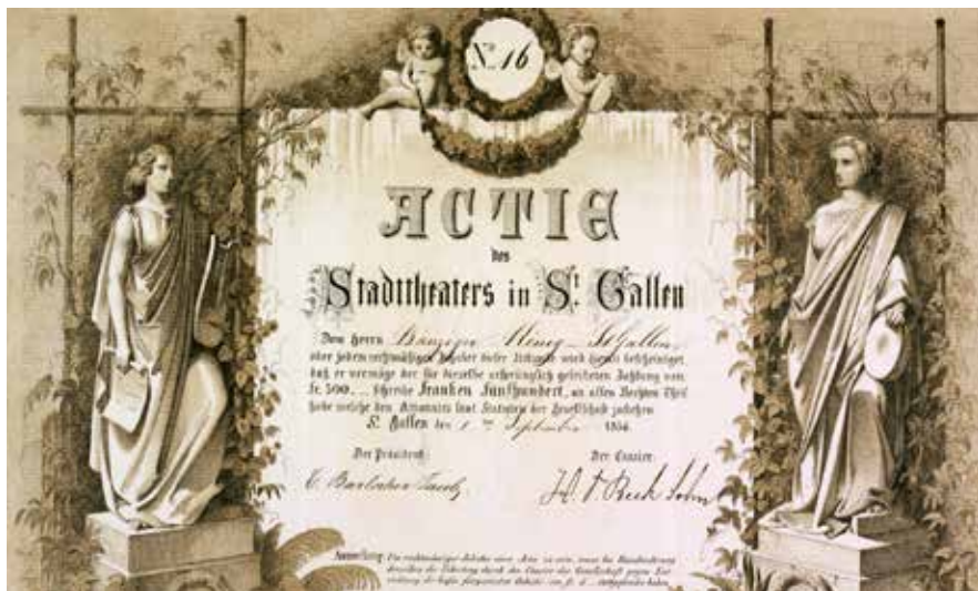
Namensaktie der Aktiengesellschaft des Stadttheaters St.Gallen über 500 Franken, ausgegeben am 1. September 1856.

Dann wurde dem Theater gekündigt. Die Theater-Kommission beschloss, einen Neubau zu erstellen, worauf ein Theater-Aktienbauverein gegründet und ein neuer Standort gesucht wurde. Auf dem ehemaligen Areal des Zeughauses, dem heutigen Marktplatz Bohl, wurde das neue Stadttheater am 5. November 1857 mit der Aufführung von Mozarts Don Giovanni eingeweiht.