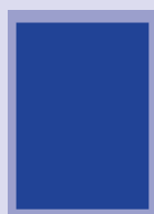
■ 1/1 Seite 210 x 297 mm ■ 1/1 Seite 178 x 265 mm