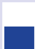
■ 1/2 Seite quer 178 x 130 mm