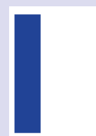
■ 1/3 Seite hoch 57 x 265 mm

■ Magazinformat, + 3 mm Beschnitt ■ Satzspiegelformat