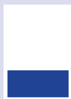
■ 1/3 Seite quer 178 x 86 mm

■ Magazinformat, + 3 mm Beschnitt ■ Satzspiegelformat