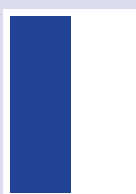
■ 1/2 Seite hoch 87 x 265 mm