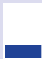
■ 1/4 Seite quer 178 x 63 mm

Beilagen, Beihefter und Beikleber auf Anfrage möglich.