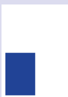
■ 1/4 Seite hoch 87 x 130 mm